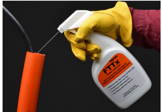
Polywater FTTx può essere spruzzato in condotti di piccole dimensioni

Conforme alle specifiche del modello MS-5/20xx per condotti a parete piena in HDPE per applicazioni di alimentazione e comunicazioni.