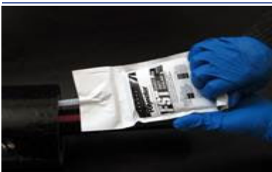
Iniezione della confezione da rompere di FST.