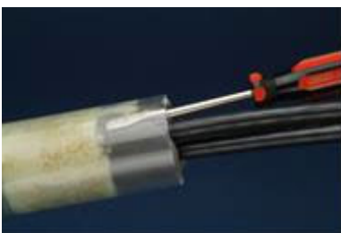
Utilizzare un cacciavite per verificare la presenza di vuoti.

Il sigillante si indurrà (farà presa) entro 15-20 minuti.