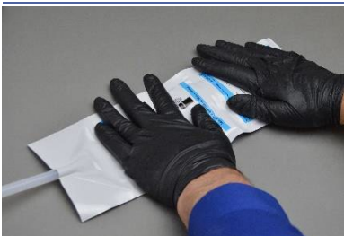
Miscelare 30 volte.