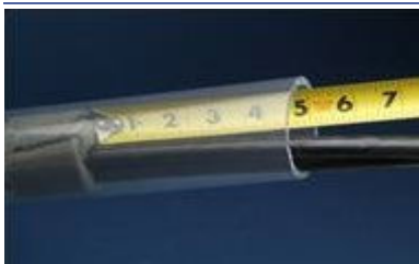
Misurare la profondità della barriera di schiuma.