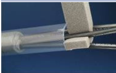
Separare i cavi con la schiuma.

Nel caso di più confezioni, applicare una confezione ogni 7 minuti.