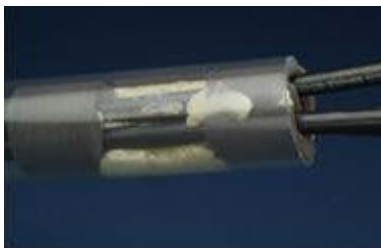
Schiuma in espansione.