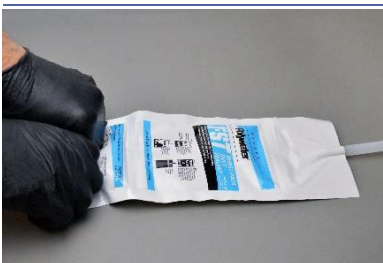
Rompere il sigillo centrale.