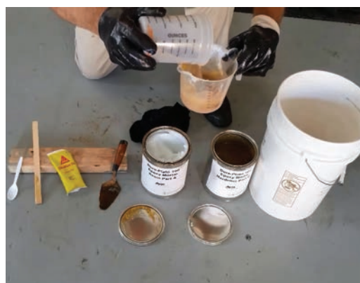
El sistema de resina de 3 partes se mezcla rápida y fácilmente sin una elaboración complicada