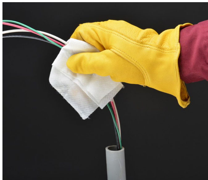
Applicazione con salvietta Polywater SPY-D20

La confezione di salviette Polywater SPY (SPY-D20) è un modo pratico per applicare il lubrificante sui cavi più corti. Ogni salvietta ricopre e lubrifica da 15 a 30 metri di cavo. Utilizzare salviette aggiuntive se necessario per pose più lunghe, più estese o più difficili. Uno strato leggero di Polywater SPY facilita la spinta o la trazione del cavo.