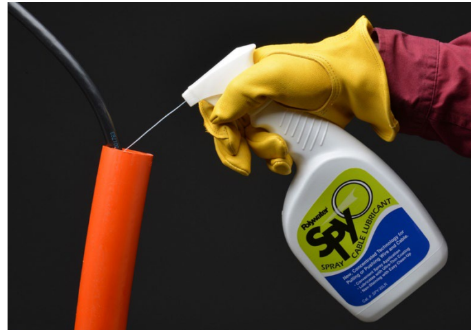
Polywater Spy può essere spruzzato direttamente nei condotti o sui cavi

Per ottenere i dati sul coefficiente di attrito sui rivestimenti di condotti per cavi aggiuntivi, richiederli ad American Polywater Corporation.