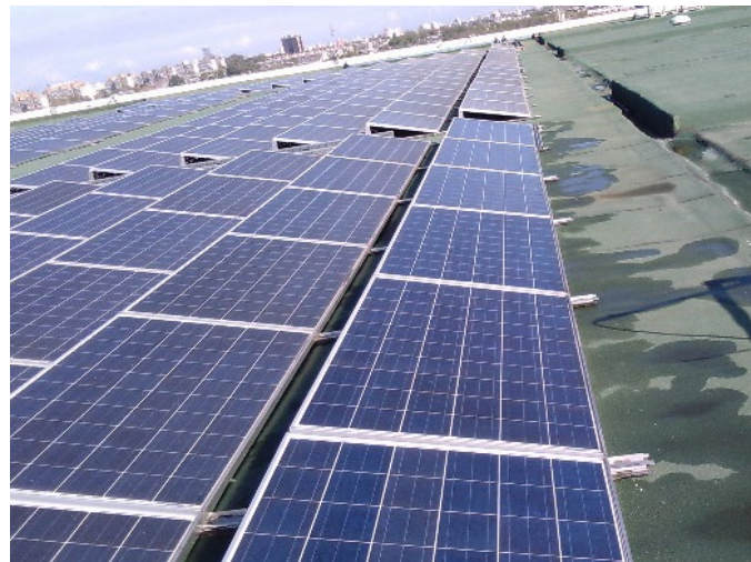
El SPW de Polywater es seguro para los usuarios y el medio ambiente.

Para obtener más información, consulte el Libro blanco sobre ahorro de agua de SPW .