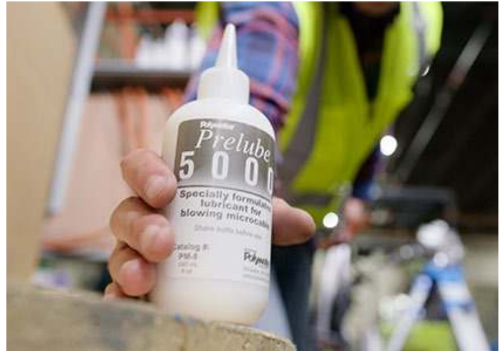
Prelube 5000 wird vor dem Einblasen eines Glasfaserkabels in das Rohr gedrückt