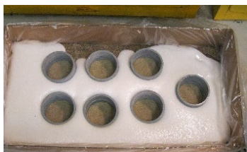
PedFloor s'écoule et entre en expansion au bout de 20 minutes

PedFloor est conçu avec un temps de prise suffisamment lent pour permettre au matériau le temps de s'écouler dans la zone ciblée. À mesure que la surface est recouverte, le matériau se dilate jusqu'à atteindre sa forme réticulaire durable définitive. Il s'écoule naturellement dans les espaces réduits sans nécessiter de talochage.