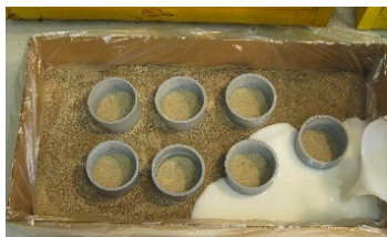
PedFloor est mélangé, puis versé.

PedFloor est facile à appliquer. Il s'écoule dans la zone ciblée et remplit les espaces vides par expansion.