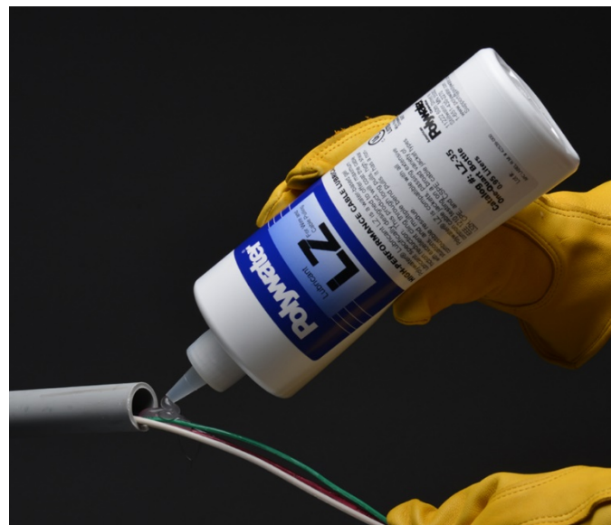
Polywater LZ ist ein spezifikationsgerechtes Schmiermittel.

Daten zum Reibungskoeffizienten anderer oder spezieller Kabelmäntel sind von Polywater erhältlich.