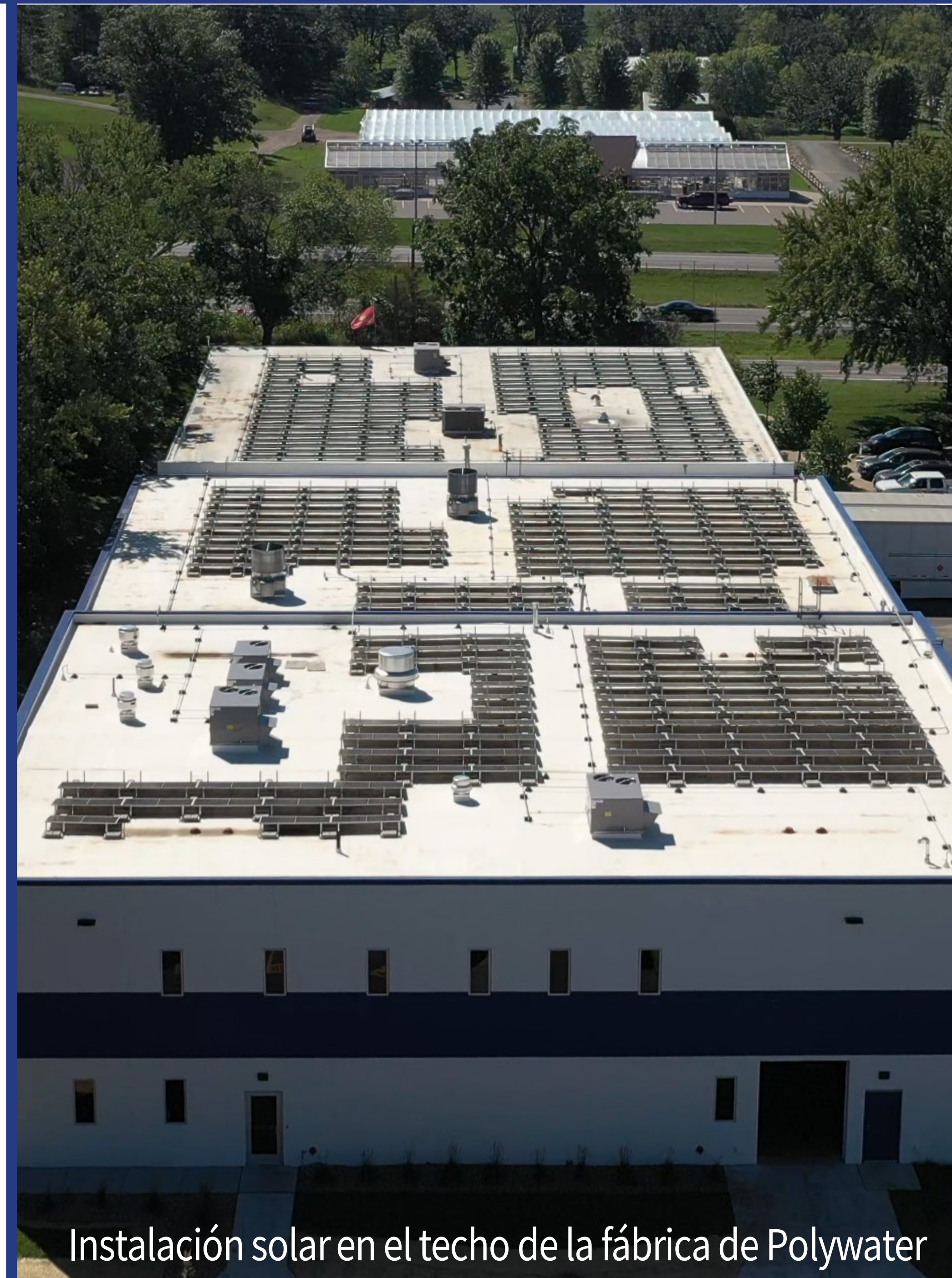
Instalación solar en el techo de la fábrica de Polywater

Polywater apoya iniciativas globales de sostenibilidad a través del análisis y la mejora continua de nuestros productos, métodos de producción y modos de transporte. El impacto ambiental y los derechos humanos son consideraciones claves en la selección de nuestras materias primas, empaques y necesidades energéticas. Si bien es cierto que las innovaciones en nuestros productos están diseñadas para apoyar el despliegue de energías renovables, muchas formulaciones y esfuerzos de I+D también apuntan a la reparación y mantenimiento de infraestructura heredada con el objetivo de aumentar la eficiencia y el tiempo de vida útil, y de disminuir el impacto ambiental en comparación con el reemplazo completo.