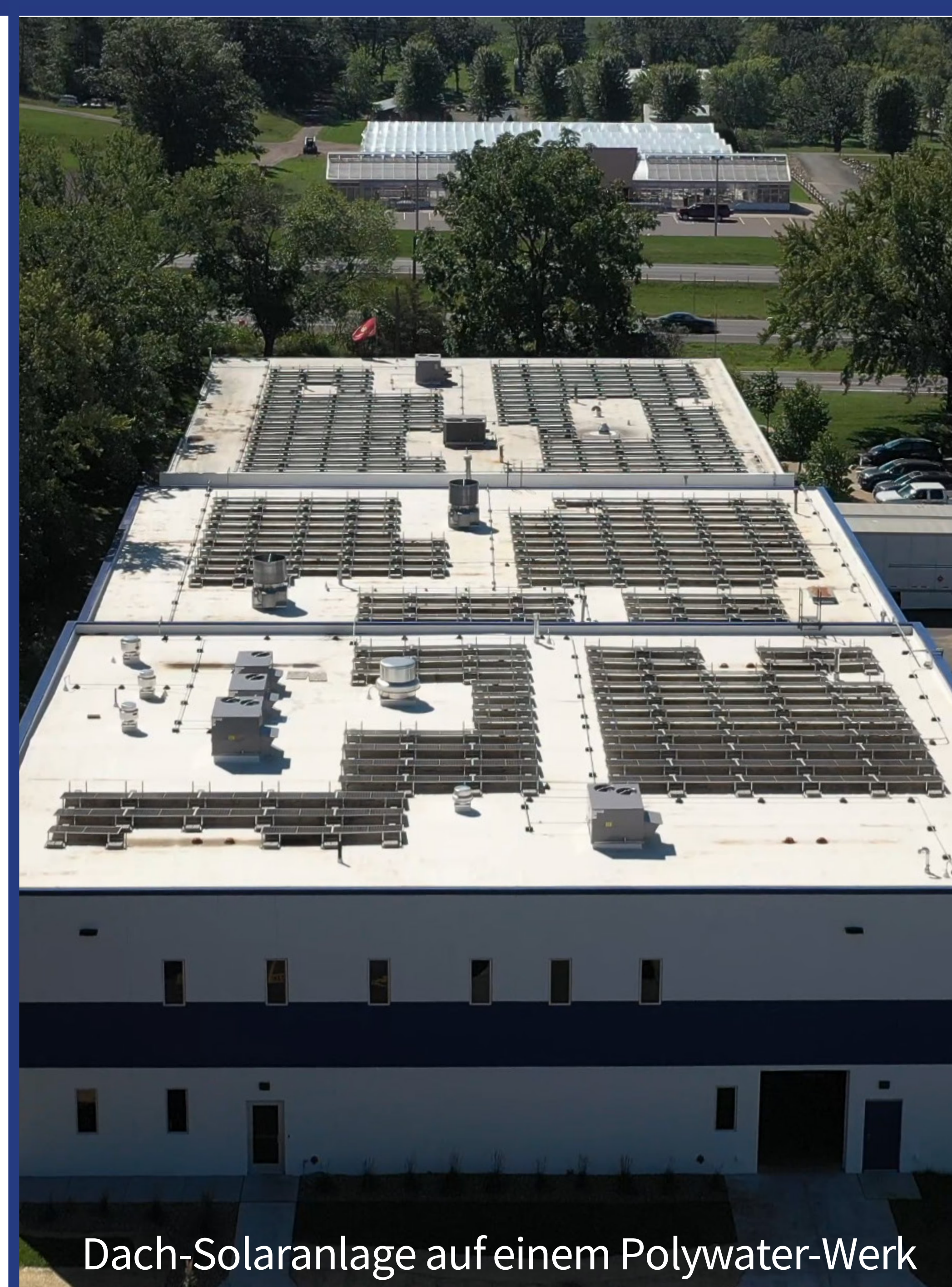
Dach-Solaranlage auf einem Polywater-Werk