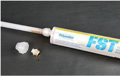
Preparare la cartuccia