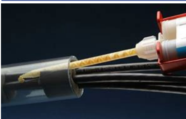
Erogare schiuma sigillante