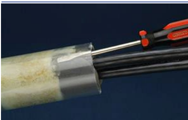
Utilizzare un cacciavite per verificare la presenza di vuoti

Il miscelatore statico è riutilizzabile 7-10 minuti dopo l'iniezione.