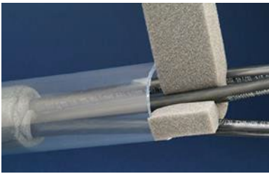
Separare i cavi con la schiuma