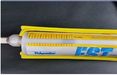
Segno sul lato della cartuccia