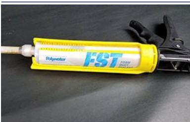
TOOL-250 con FST-250

Tenendo la cartuccia in posizione verticale, rimuovere il dado e il tappo. (Il tappo può essere conservato per riutilizzare la cartuccia.) Collegare il miscelatore statico e serrarlo in posizione.