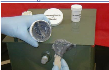
Appliquer PowerPatch par-dessus le patch de mastic ou la zone de fuite

Vider tout le contenu du pot de la partie B dans le pot plus grand de la partie A. Mélanger pendant 1 à 2 minutes, jusqu'à ce que la mixture soit d'une couleur grise uniforme.