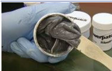
Mélanger les deux pâtes du produit d'étanchéité jusqu'à obtenir un gris uniforme