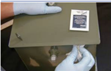
Nettoyer la zone avec une lingette nettoyante avant d'appliquer le produit d'étanchéité.

En cas de fuites actives, appliquer le mastic pour colmater temporairement le liquide. En l'absence de fuites actives, continuer à l'étape 4.