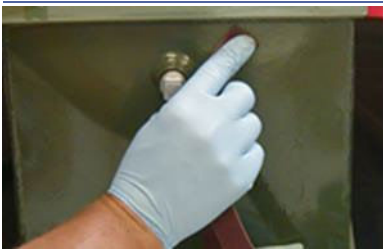
Poncer ou brosser la zone de réparation