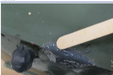
Lisser les bords