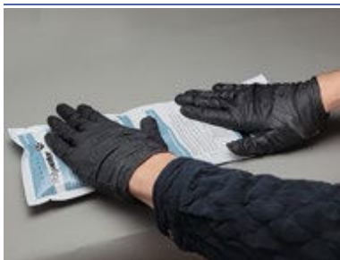
Pétrir la poche d'éclatement