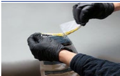
Déchirer le coin de la poche d'éclatement

Bien mélanger. Les deux parties doivent être entièrement combinées pour de meilleurs résultats.