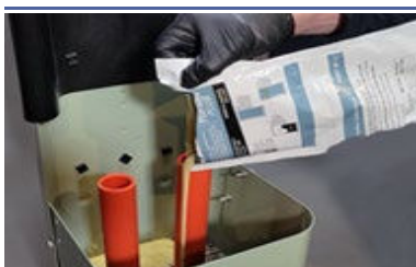
Appliquer PedFloor Plus

Le sac doit commencer à se dilater et à se réchauffer légèrement avant de verser le produit.