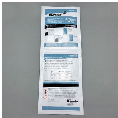
Pedfloor Plus Burst Pack

PRÉVOIR UN INSTRUMENT DE DÉCOUPE POUR OUVRIR UN COIN DU SAC SI LA LANGUETTE D'OUVERTURE NE FONCTIONNE PAS