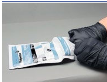
Éclater le joint principal