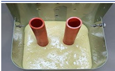
Comblar les écarts avec FSTBP or PFP

PedFloor Plus doit monter entre les conduits/câbles si une application uniforme n'est pas possible.