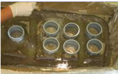
Distribuya el InstaGrout con una cuchara

Para obtener mejores resultados, aplique el material por toda el área a tratar para formar una película delgada de InstaGrout de unos 0.6 a 1.0 cm (1/4 a 3/8 pulg.) de espesor.