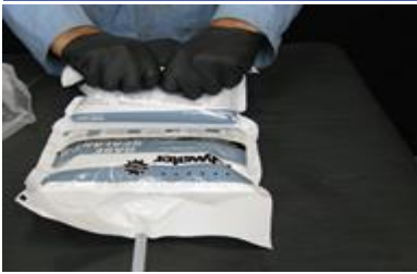
Rompa el sello principal