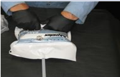
Rotura del sello secundario

Mezcle bien. Las dos partes deben estar totalmente combinadas para obtener los mejores resultados.