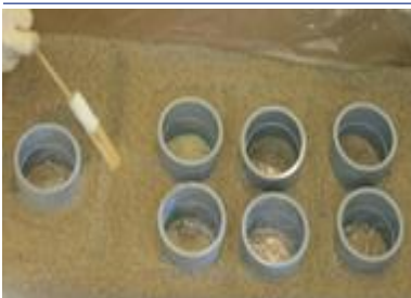
Cree canales superficiales para dirigir el flujo