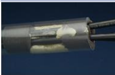
Espuma que se dilata.