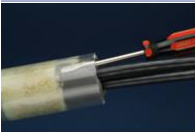
Use un destornillador para revisar si hay espacios vacíos.

El sellador se endurecerá (fraguará) en 15-20 minutos.