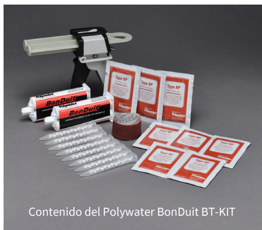
Contenido del Polywater BonDuit BT-KIT